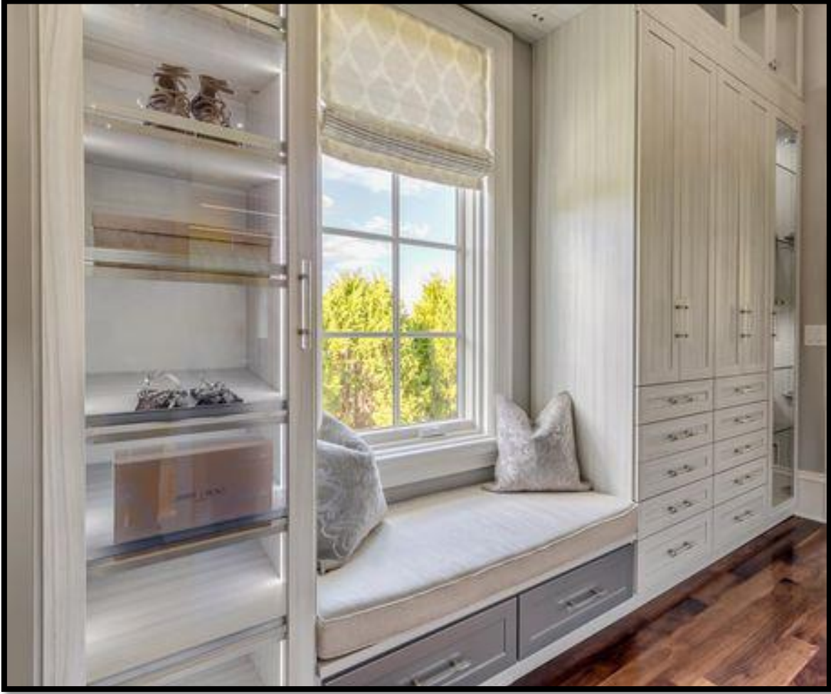
الشكل رقم 2